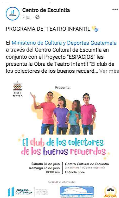
Foto 3: Publicación en redes sociales del CCE, en fecha 07/07/22, acerca de las presentaciones próximas a realizarse en Escuintla.