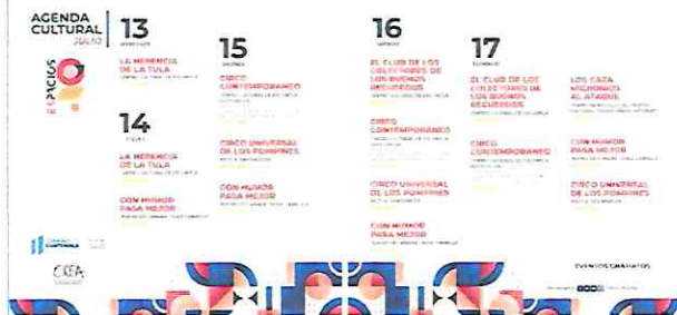
Foto 6: Publicación en redes sociales del MCD, en fecha 11/07/22, de la Agenda Cultural de Espacios, donde se incluye las 2 presentaciones a realizarse en Escuintla.

Conoce la agenda semanal de las actividades de #Espacios. Para más información sobre la reserva de boletos ingresa aquí h... Ver más