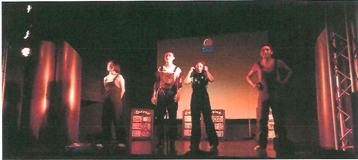
Foto 17: Presentación domingo 31/07/22, interactuando con el público.