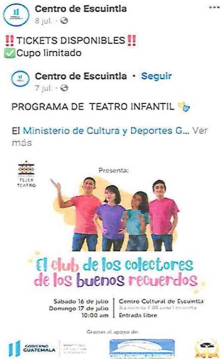
Foto 4: Publicación en redes sociales del CCE, en fecha 08/07/22, acerca de las presentaciones próximas a realizarse en Escuintla.