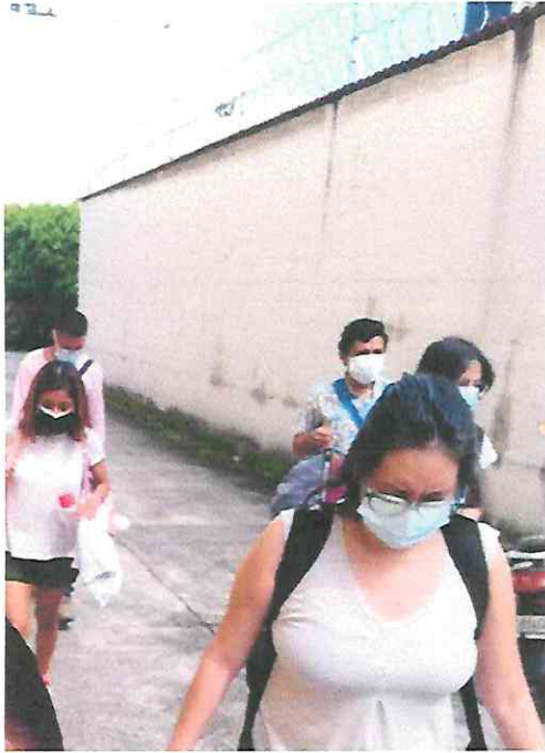
Foto 8: Tejer Teatro, llegando al Centro Cultural de Escuintla. Sábado 16/07/22.