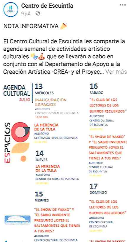
Foto 5: Publicación en redes sociales del CCE, en fecha 09/07/22, de la Agenda Cultural de Espacios, con las distintas actividades artísticas a realizarse en Escuintla.