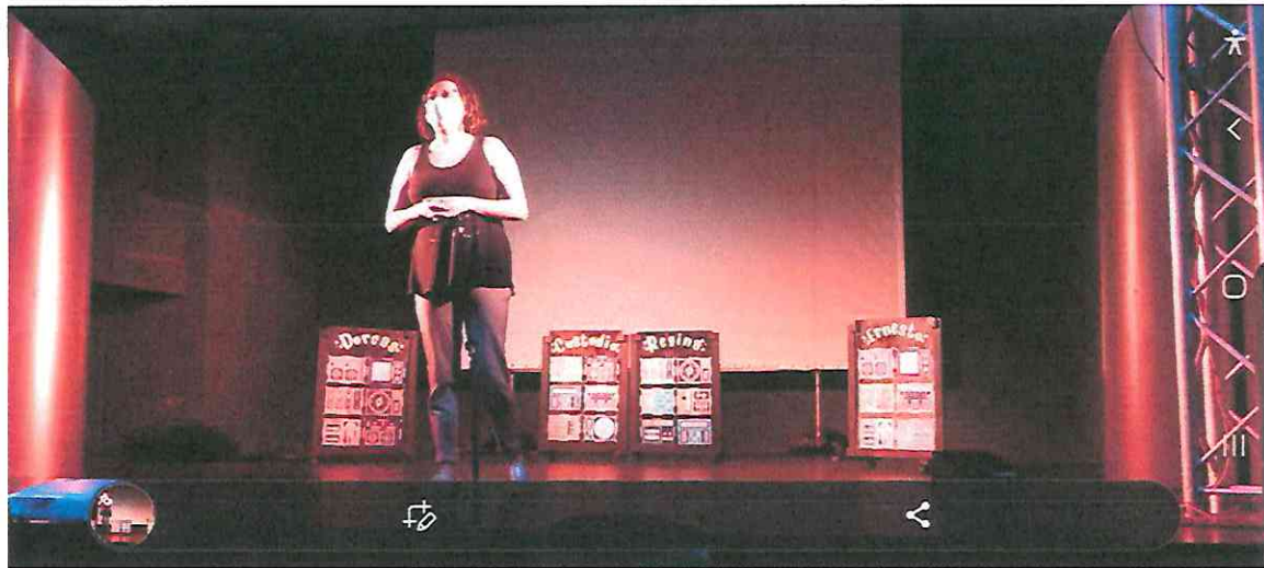
Foto 18: Presentación domingo 31/07/22, palabras finales de la directora.