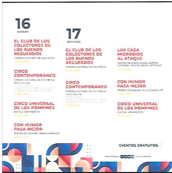
Foto 2: Arte de cartelera de funciones a presentarse en Escuintla